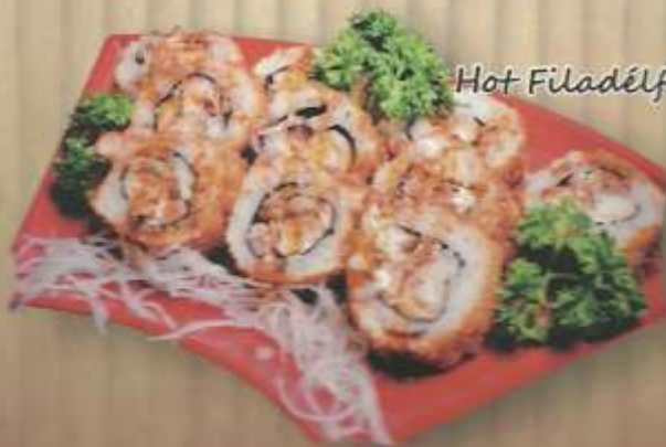
Hot Filadélfia Especial

Camarão empanado, cream cheese e cebolinha.....R$ 21,00